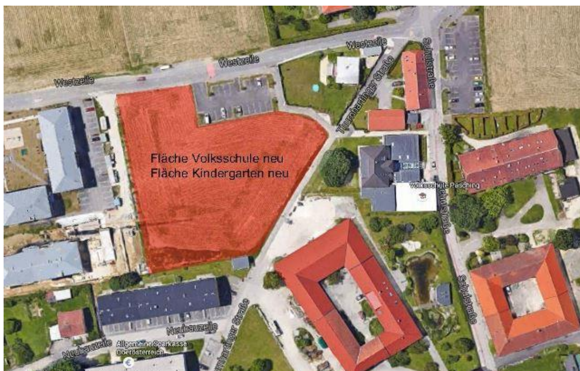
Luftbild PASCHING ORT / vorgesehene Baufläche für Volksschule und Kindergarten, begrenzt durch WESTZEILE und THURNHARTINGER Straße.